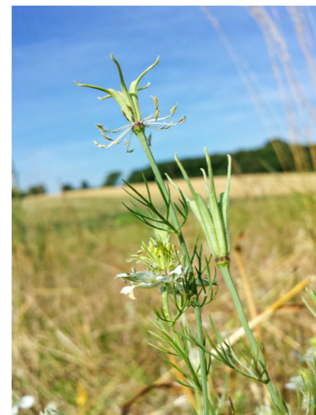
Der Acker-Schwarzkümmel ist heute nur noch im Osten Österreichs anzutreffen und dort ist er "stark gefährdet".

Beim Schwarzkümmel hat sich im Laufe der Evolution ein ausgefeilter Blütenaufbau entwickelt, der die Bestäubung optimiert. Auch heimische Insektenarten können durch die Dominanz des Japanischen Staudenknöterichs verdrängt werden. So wird bspw. bei Verdrängung von Blutweiderich (Lythrum salicaria) die Nahrungsgrundlage der Sägehornbiene (Melitta nigricans) eingeschränkt, wodurch diese dann seltener wird.